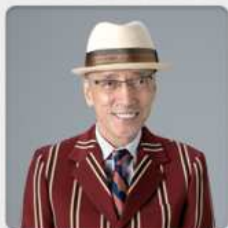
テリー伊藤 メインサポーター

AV OPEN 2014とは、国内史上最大規模で行うアダルトビデオの祭典であり、アダルトコンテンツ業界の発展・振興に寄与することを目的としたイベントであります。11月14日（金）本イベントステージにてついに初代チャンピオンが決定いたします。